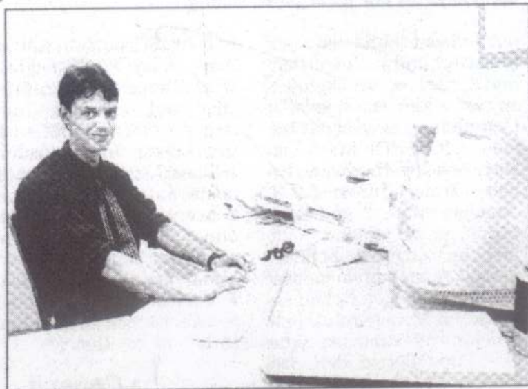
Am Computer werden die Vorlagen bearbeitet und für die Laserbeschriftung vorbereitet.

„Die Vorteile der Lasergravur beziehungsweise der Laserbeschriftung sind kaum zu überbieten, denn